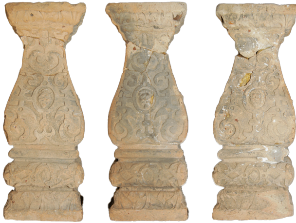
Fragment eines Ofenfußes in Gestalt eines Balusters mit Beschlagwerk, Medaillon mit Löwen mit Ring im Maul, graphitiert, Anfang 17. Jh., H. 39,2 cm; Br. 11,0 cm, Bad Kreuznach, Museum im Rittergut Bangert

zichten auf eine Aussparung für einen vertikalen Eisenstab. Vollplastisch über einen Steinkern aufgebaut war bereits ihre Produktion höchst problematisch.