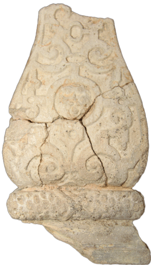
Fragment eines Ofenfußes in Gestalt eines Balusters mit Beschlagwerk, Medaillon mit Löwen mit Ring im Maul, graphitiert, Anfang 17. Jh., H. 19,2 cm; Br. 10,4 cm, Mannheim, Reiss-Engelhorn-Museum, urspr. Mannheim H 3.11

Der Sockel des ursprünglich schlanken Ofenfußes setzt sich aus einer glatten Platte unter einer akantusblattbesetzten Kehle zusammen. Darüber krägt eine als glatter Halbstab gebildete Leiste kissenartig aus. Den Gutteil des Raumes nimmt darüber ein tropfenförmig sich nach unten verbreiterndes Versatzteil ein. Es weist ebenso wie die Leiste darunter eine Verzierung mit kleinteiligem Beschlagwerk auf. Darüber hinaus sind auf dem trapezförmigen Gebilde die zentralen, hochovalen Medaillons auf allen vier Seiten jeweils mit einem Löwenkopf besetzt. Der an dem Mannheimer Stück nicht mehr erhaltene obere Abschluss wurde als spiegelbildliches Gegenstück zum Sockel gearbeitet.