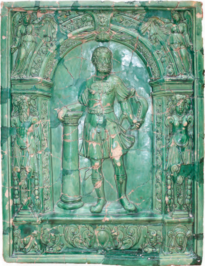
Abb. 4. Fragment einer Blattkachel der Serie der alttestamentarischen Helden Nürnberger Art: Samson in antiker Rüstung mit der Kinnbacke eines Esels in seiner Linken, sich auf eine Säule stützend, das Ganze in einer Arkade mit einem Frauenkopf mit Radhauben und Serviettenkragen im Sockel unter armlosen Hermenpfeilern bzw. Karyatidenpfeilern, mit Rollwerk besetzter Archivolte, einer mit Löwenmaske in Rollwerk besetzten Konsole im Bogenscheitel, von der zu beiden Seiten ein tuchenes Feston ausgeht, das von zwei stehenden Engeln in den Zwickeln gehalten wird. Grünglasierte Irdeware, 65,9 cm x 50,7 cm. Hilpoltstein, Museum „Schwarzes Roß“.