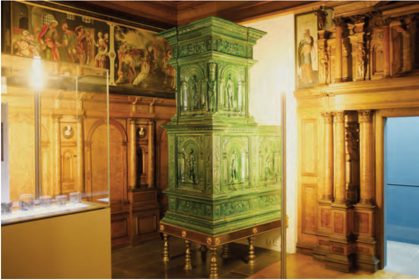
Abb. 5. Kachelofen mit der Serie der Planetengötter aus der Karlstraße 3 in Nürnberg, zugeschrieben Wolfgang Leupold, um 1592. Grünglasierte Irdenware, H. 2,99 cm. Nürnberg, Germanisches Nationalmuseum, Inv.-Nr. A 3431.

Ausgangspunkt für eine Visualisierung des hier vorgestellten Manierismusofens 28 ist ein Kachelofen mit den Verkörperungen der Planeten im Germanischen Nationalmuseum in Nürnberg (Abb. 5). 29 Er stand bis 1963 in der Karlstraße 3 in Nürnberg. Die rauchfreie Raumheizung ist 299 cm hoch und 107 cm breit (Stirnseite). Eine dicke Sockelplatte ruht auf mehreren metallenen Füßen. Über ihr erhebt sich der zweiteilige Ofen, bestehend aus einem Feuerkasten und einem Oberofen. Die mit reliefierten Blatt- und Eckkacheln besetzten Bildfelder der beiden kubischen Ofenteile sind in sich jeweils horizontal durch Gesimse in ungleich hohe Zonen unterteilt. Weitere Gesimse schließen die beiden Kompartimente nach oben und nach unten ab.