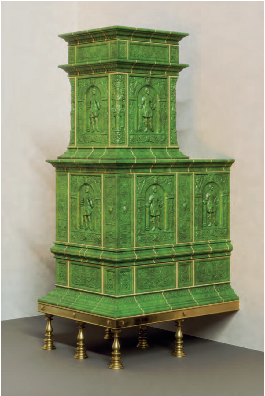
Abb. 6. Rekonstruktion des Ofens mit den alttestamentarischen Propheten Nürnberger Art von der Burg Hilpoltstein (Fundort). (Visualisierung: Sabrina Bachmann, Heimbuchenthal).