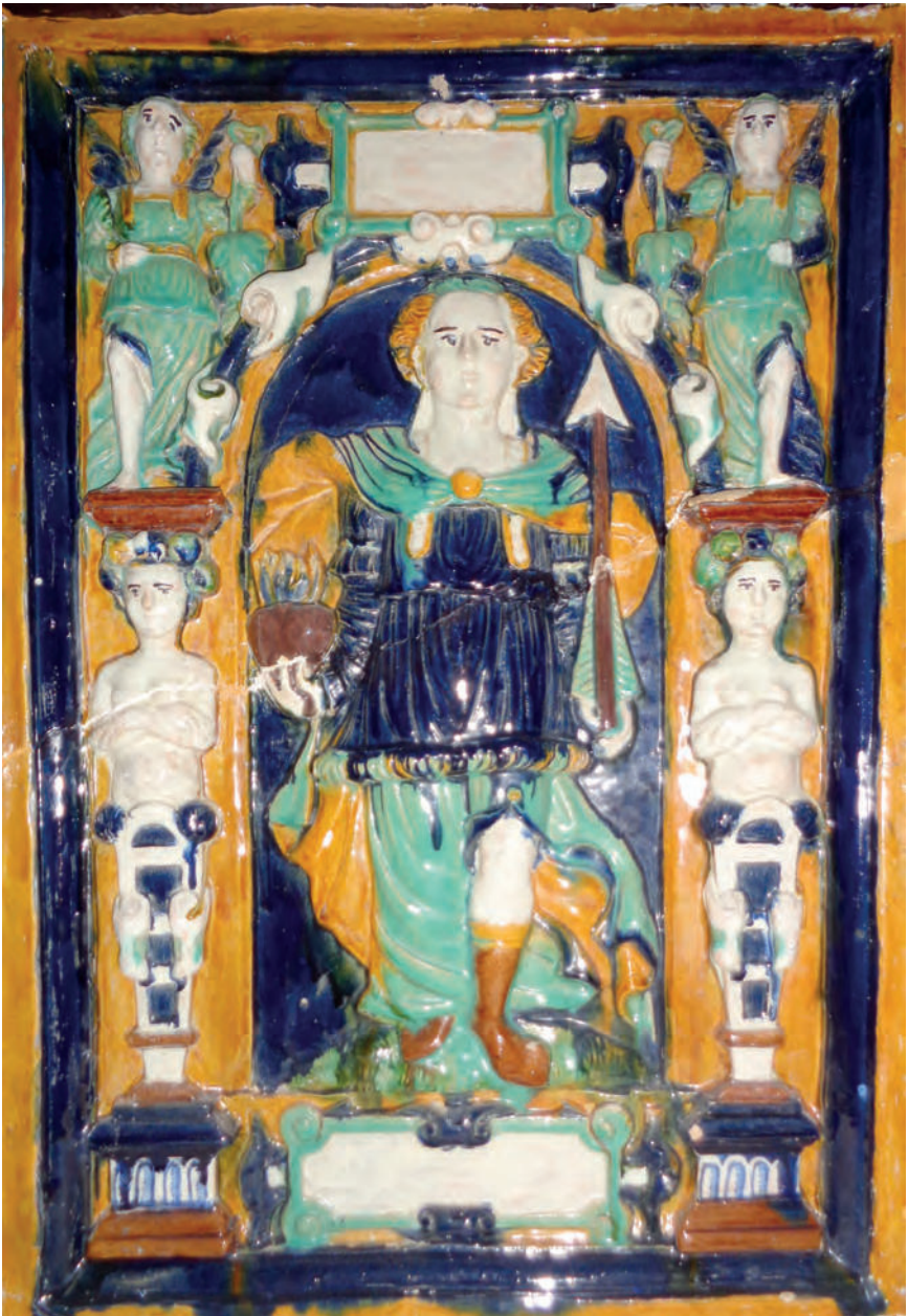
Abb. 3. Blattkachel aus der Serie der stehenden Planeten mit Venus, eingebunden in einen Kachelofen. Polychrom glasierte Irdenware, 54,0 cm x 36,0 cm. Leogang, Bergbau- und Gotikmuseum, Leihgabe des Museums für angewandte Kunst/MAK Wien, Inv.-Nr. Ke 7819.