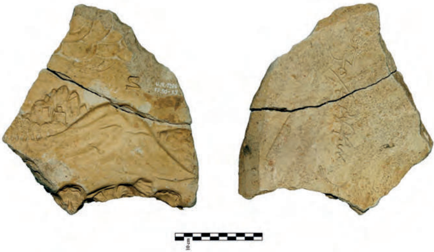
Abb. 11. Fragment des Modells des Innenfelds einer Blattkachel aus dem Josephszyklus nach Johannes Vest: Verkauf an die Ismaeliten, rückseitig signiert von Jost Affers. Unglasierte Irdenware, 13,5 cm x 12,34 cm. Heidelberg, Kurpfälzisches Museum, Archäologie, Karton Nr. 3047.

Josephsgeschichte (Abb. 11) 51 sowie Allegorien der Weltreiche zu Pferde, 52 der Freien Künste und der Sinne. Auffällig hoch ist der Anteil von Ornamentalem, der beispielsweise auf Tapetendekoren seinen Niederschlag fand.