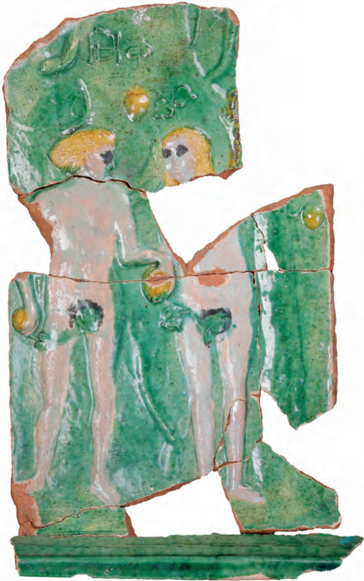
Abb. 9. Fragment einer Blattkachel mit einteiligem Sündenfall mit Adam und Eva als stehende Ganzfiguren unter dem Baum der Erkenntnis in einer Doppelarkade mit lisenenbesetzten Pfeilern, einer kassettierten, blütenbesetzten Bogenlaibung, einer kassettierten, blütenbesetzten Archivolte sowie mit Akanthusrosetten in den Zwickeln. Polychrom glasierte Irdenware, 23,4 cm x 14,6 cm. Ingolstadt, Stadtmuseum, Inv.-Nr. A 07648 (Foto: Harald Rosmanitz, Partenstein).