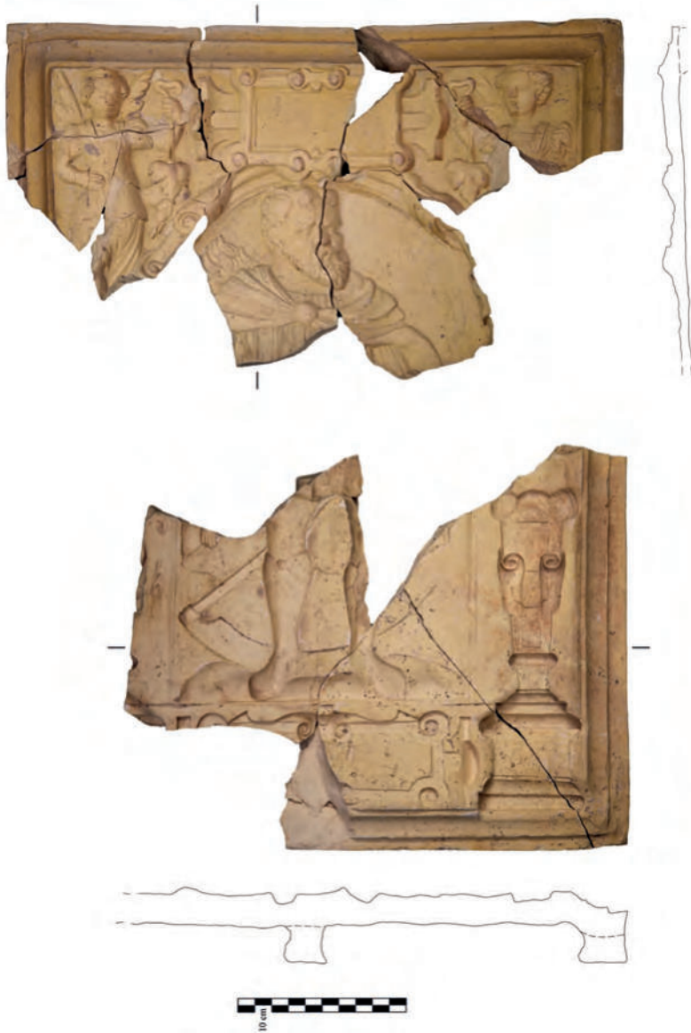
Abb. 2. Fragmente des Modells einer Blattkachel der Serie der Planeten mit stehendem, bärtigem Mann mit abgewinkelter rechter Hand (oben) und Fragment des Modells einer Blattkachel der Serie der Planeten: Saturn mit Kind und Sense (unten), beide in einer Arkade mit hoher Sockelzone mit rollwerkbesetzter Inschriftenkartusche, beidseitig flankiert von Hermen- und Karyatidenpfeilern auf hohen Sockeln. Unglasierte Irdenware, 21,0 cm x 37,0 cm bzw. 24,2 cm x 31,0 cm. Halle, Landesamt für Denkmalpflege und Archäologie Sachsen-Anhalt, Inv.-Nr. 12619: 0019: 01v.