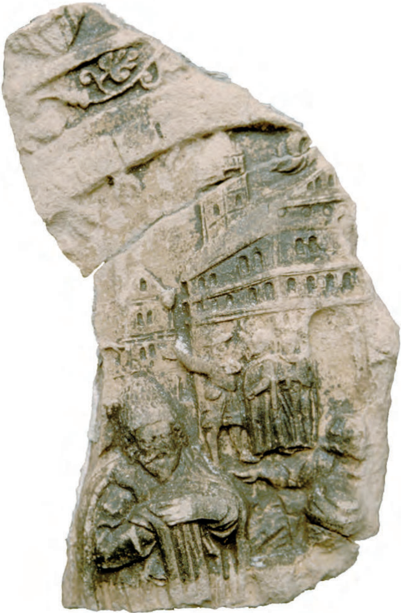
Abb. 10. Fragment des Innenfelds einer Blattkachel mit Jakobsgeschichte in der Art von Johannes Vest. Graphitierte Irdeware, 21,0 cm x 15,0 cm. Heidelberg Schloss Inv.-Nr. A 219 (Foto: Harald Rosmanitz, Partenstein).