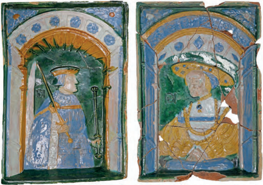
Abb. 8. Zwei Blattkacheln mit Herrscherpaar in Renaissancestracht in einer Arkade mit glatten Pfeilern und blütenbesetzter Biogenlaibung vom Ofen von 1540/50 im Neuen Schloss in Ingolstadt. Polychrom glasierte Irdenware, 29,6 cm x 20,4 cm. Ingolstadt, Stadtmuseum, Inv.-Nr. A 07648 (Foto: Harald Rosmanitz, Partenstein).

zwischen 1540 und 1550 entstandenen mehrfarbigen Kacheln verdeutlicht das Ineinanderlaufen von Farbfeldern, insbesondere im Bereich der Augenpartien, dass die wieder aufgegriffene Glasurtechnik nicht mehr zur gewünschten Perfektion zu bringen war. 43